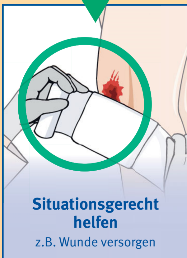
Situationsgerecht helfen z.B. Wunde versorgen