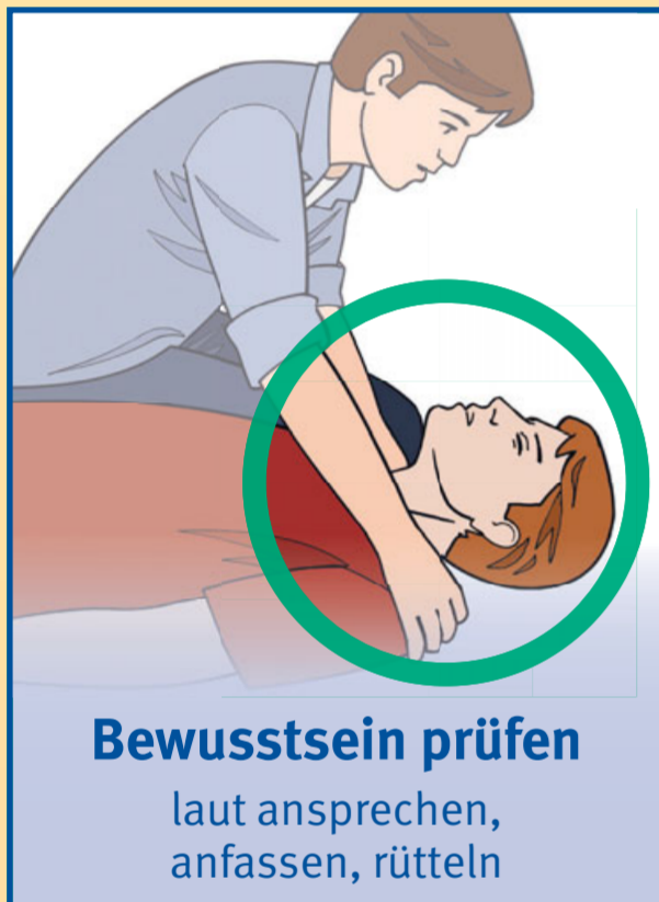
Bewusstsein prüfen laut ansprechen, anfassen, rütteln