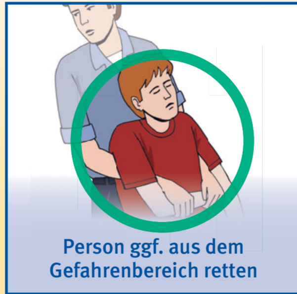
Person ggf. aus dem Gefahrenbereich retten