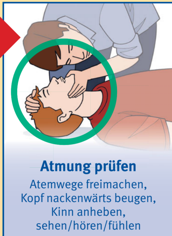
Atemung prüfen Atemwege freimachen, Kopf nackenwärts beugen, Kinn anheben, sehen/hören/fühlen